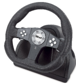
Volant avec boutons d'action