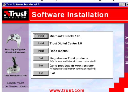
Figura 2: O Trust Software Installer