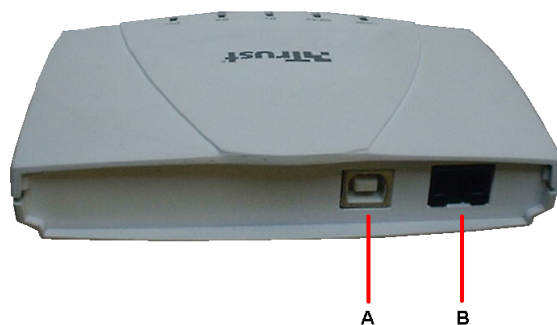
Figura 1: ISDN USB Modem