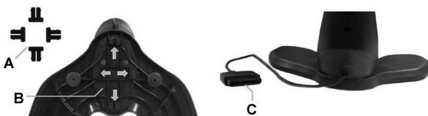
Figura 1: Las piezas del volante

Para la instalación y la conexión del volante, siga las siguientes instrucciones: