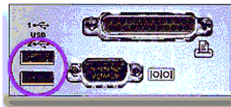
Figura 3: Collegamento al computer