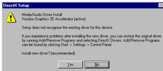
Figuur 3: Installatiescherm DirectX5