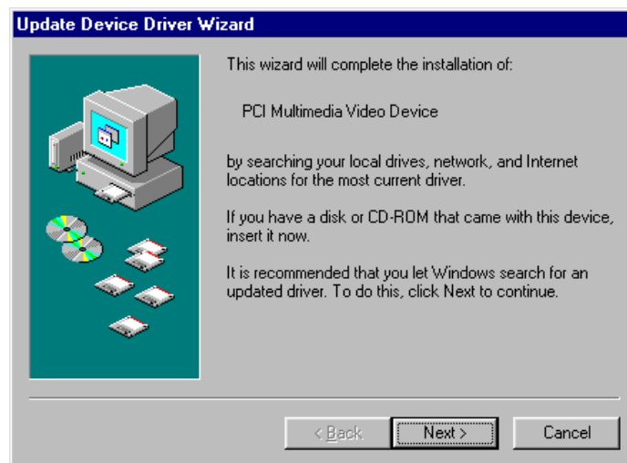
Figuur 2: Automatische herkenning in Windows