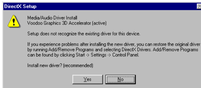
Figure 3 : Ecran d'installation DirectX5