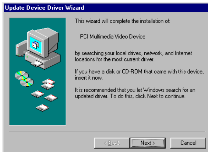
Figure 2 : Reconnaissance automatique de Windows